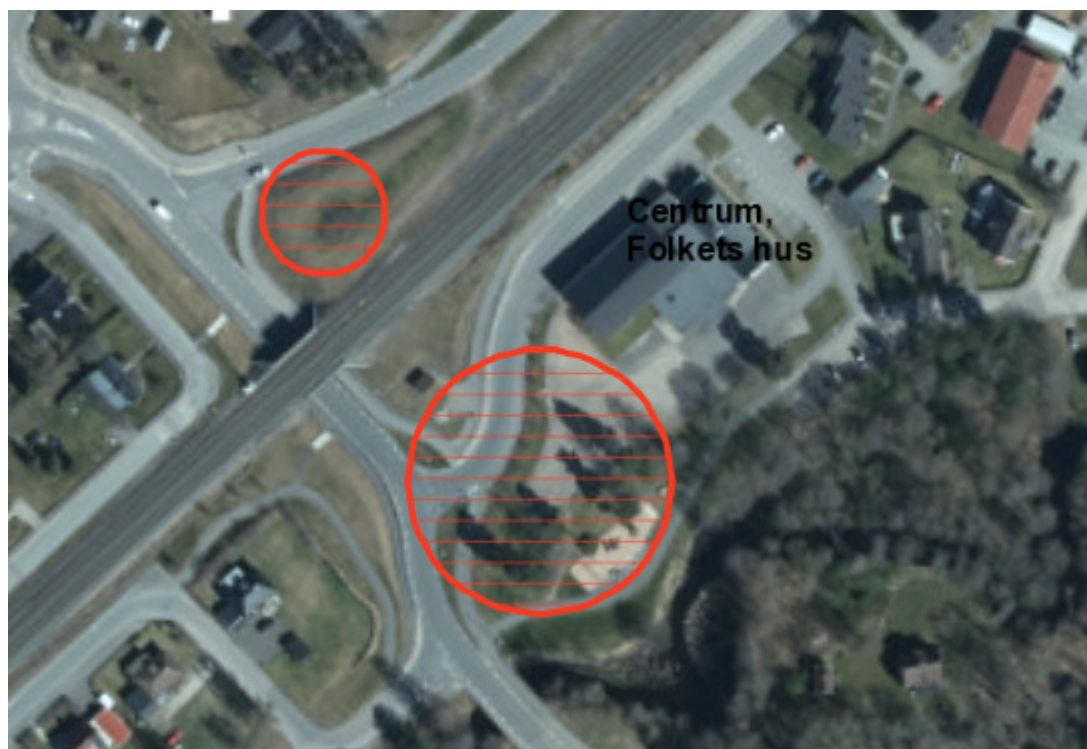
Vaggeryd, Linnégatan – Östergatan, gräsyta vid rondell