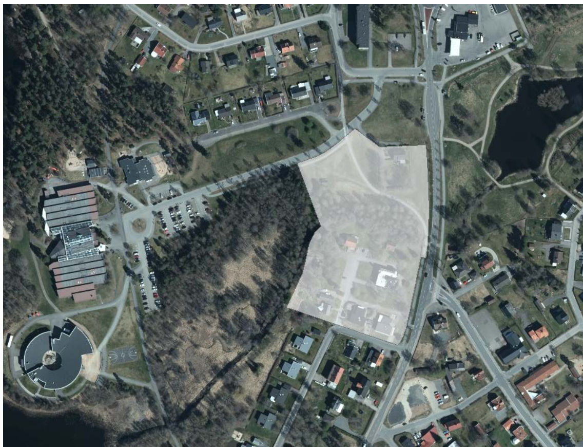
Figur 1: Föreslaget planområde