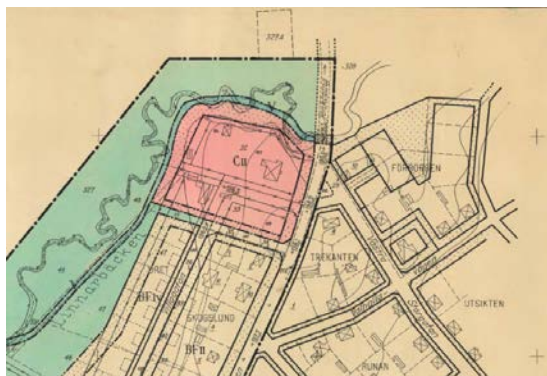
1. Ändring av stadsplanen för kv. Ankaret m.fl. Laga kraft 1961-11-11.