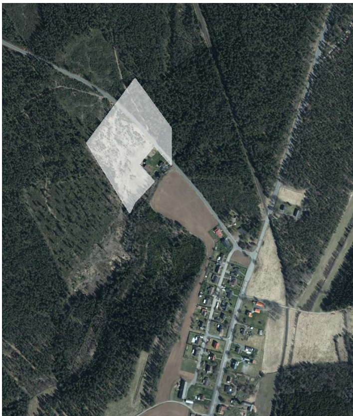
Figur 1: Föreslaget planområde på fastigheten Ammelund 1:6

Planområdet ligger nordväst om Byarums samhälle. Området avser fastigheten Ammelund 1:6 som har en areal på cirka 2,4 hektar. Fastigheten föreslås att i sin helhet exploateras. I dagsläget finns ingen befintlig bebyggelse inom området.