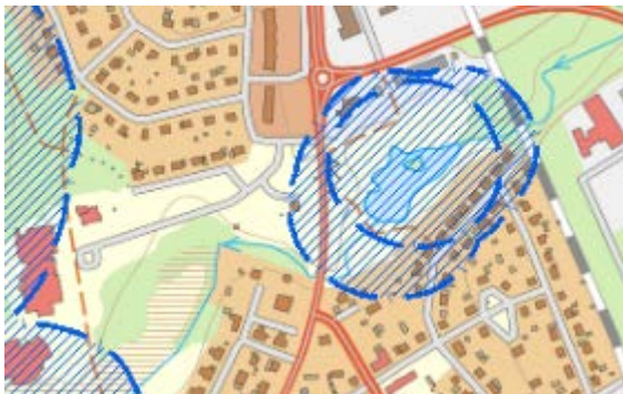
Figur 2: Strandskyddsområde runt Linnarsjön

Kring Linnarbäcken föreligger inget strandskydd. Strandskyddsområde finns däremot runt Linnarsjön, som ligger nordöst om fastigheten Fridhem 1. Nordöstra delen av föreslaget planområde omfattas till viss del av strandskyddet.