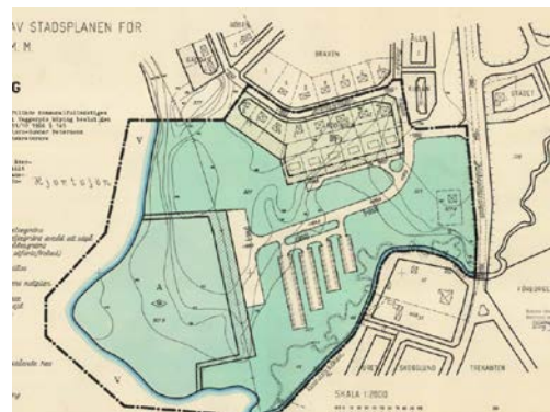
2. Ändring av stadsplanen för kv. Rödingen m.m. Å Torsboområdet. Laga kraft 1967-04-14.

Ny planläggning innebär att den nya detaljplanen ersätter del av 1. Ändring av stadsplanen för kv. Ankaret m.fl. samt del av 2. Ändring av stadsplanen för kv. Rödingen m.m. Å torsboområdet.