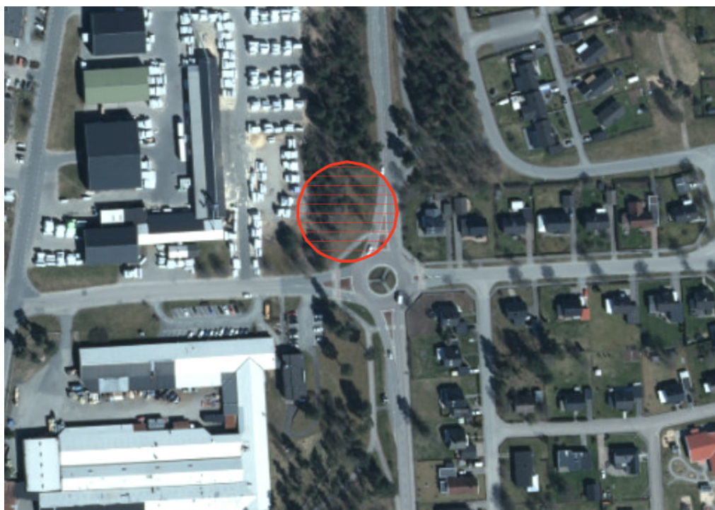
Hok centrum, Lindegatan - Kapellgatan